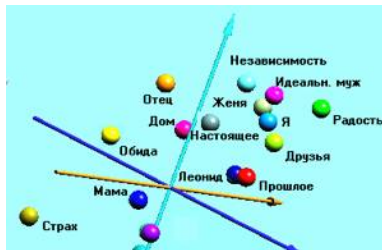
Рис.2. ОПК после психотерапии

показывая действительную оценку пациентом шкалируемых объектов, при этом на сознательном уровне пациент может оценивать эти объекты иначе или прямо противоположным образом.